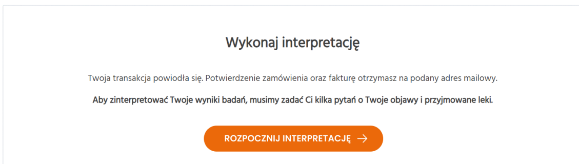
Rys. 3. Strona wskazująca przejście do etapu ankiety

Ankieta / wywiad medyczny to etap, podczas którego prosimy Cię o udzielenie odpowiedzi na pytania związane z Twoim stanem zdrowia. System dostosowuje pytania do Twoich wyników badań laboratoryjnych oraz odpowiedzi, których udzielasz, dzięki czemu skraca się długość wywiadu. Kliknij „Rozpocznij”, aby móc odpowiadać na pytania.