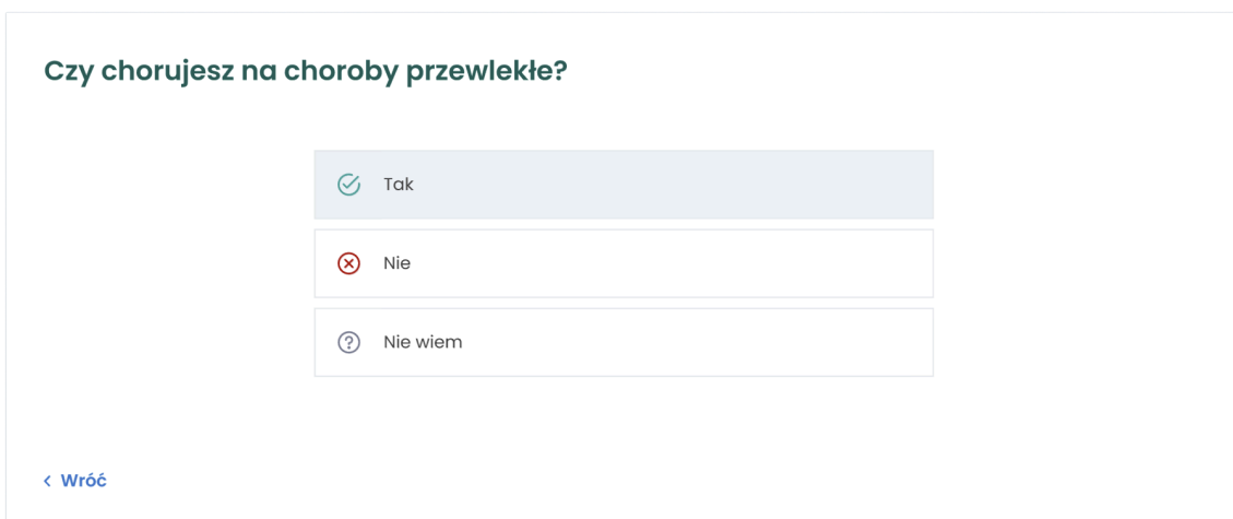
Rys. 4. Fragment ankiety medycznej

Prosimy, byś odpowiadał na pytania zgodnie z aktualną wiedzą na temat stanu swojego zdrowia. Jeżeli nie wiesz, czy dany objaw, zaburzenie lub czynnik ryzyka u Ciebie występuje, wybierz odpowiedź „Nie wiem”. Przewidywany czas potrzebny na uzupełnienie wywiadu to około 2 minut, w zależności od złożoności Twojej sytuacji. Aby przejść do kolejnej strony, kliknij „Dalej”. W każdej chwili możesz wrócić do wcześniejszych pytań, wybierając przycisk „Wróć”.